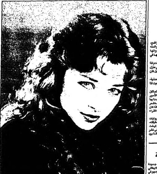
فايزة كمال في التمثيل

صحة بالقرنيتين، تحول الرواية إلى قصة واقعية. حنيف قرشي هو من الجيل الثاني من الروائيين الباكستانيين الذين يكتبون بالإنجليزية. كتابه «قبركة» يتناول حياة عائلته في باكستان، وهو من أفضل أعماله حتى الآن. حنيف قرشي ولد في مدينة كراتشي، وهي واحدة من المدن الكبيرة في باكستان. كتابه «قبركة» يتناول حياة عائلته في باكستان، وهو من أفضل أعماله حتى الآن.